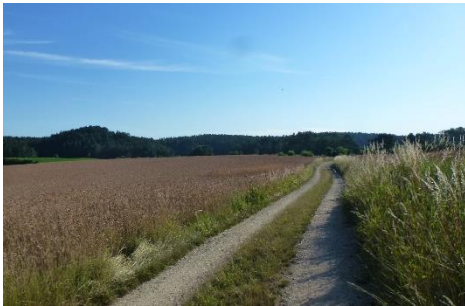
Blick Richtung Schwalbenstein; Foto: V. Frauenknecht