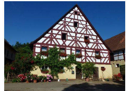
Fachwerkhaus in Pfaffenhofen

Gastronomie: Restaurant „Eckartsberg“/„Fischkutter“ in Velden Gasthof „Zur Traube“ in Velden Cafe „Central“ in Velden Pizzeria „Canale Grande“ in Velden